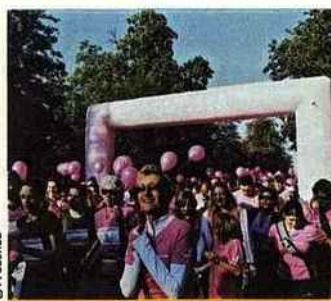
Odyssea, courir contre le cancer [12 e ]

Pour sa sixième édition, le salon de la Céramique d'art contemporaine présente, du 7 au 11 octobre, les créations