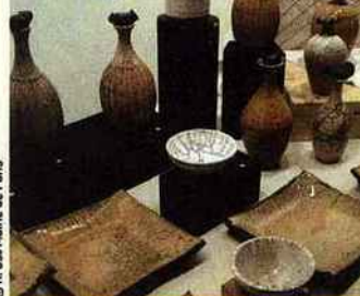
Salon de la céramique [14 e ]