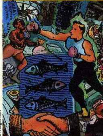
Toile de Philippe Lagautrière [15 e ]