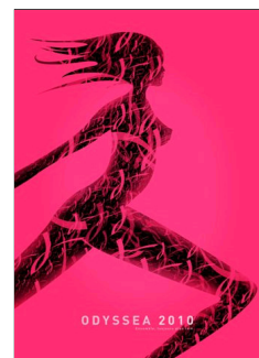
Création Stéphane Goddard pour ODYSSEA