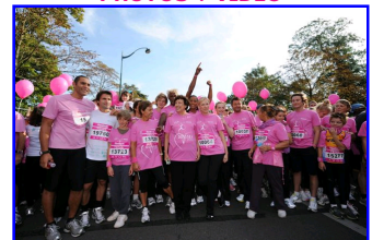
Personnalités au départ