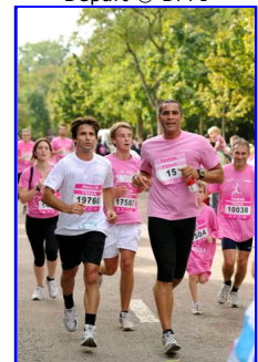
F.Santoro R.Dacoury© DPPI