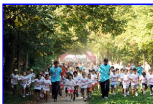
Course enfant "je cours pour maman"