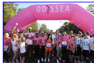
Départ + Personnalités