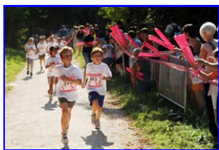
Course enfant "je cours pour maman"